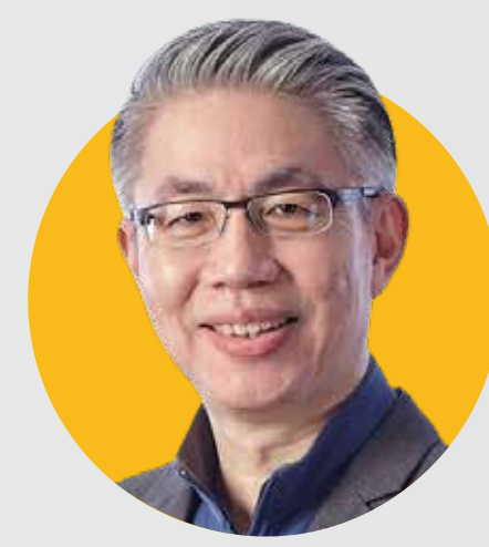
คุณณัฐพล รังสิตพล ปลัดกระทรวงอุตสาหกรรม